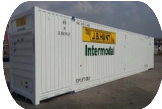
53 ' Американская Ж.Д